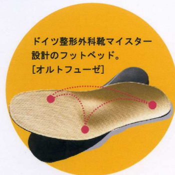
ドイツ整形外科靴マイスター設計のフットベッド。 [オルトフューゼ]