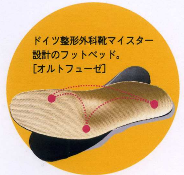
ドイツ整形外科靴マイスター設計のフットベッド。 [オルトフューゼ]