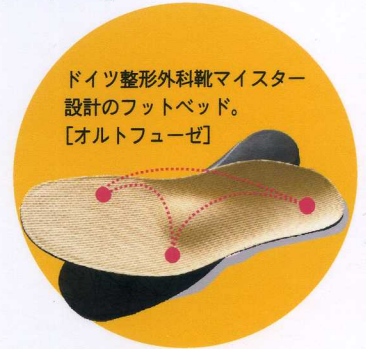
ドイツ整形外科靴マイスター設計のフットベッド。 [オルトフューゼ]